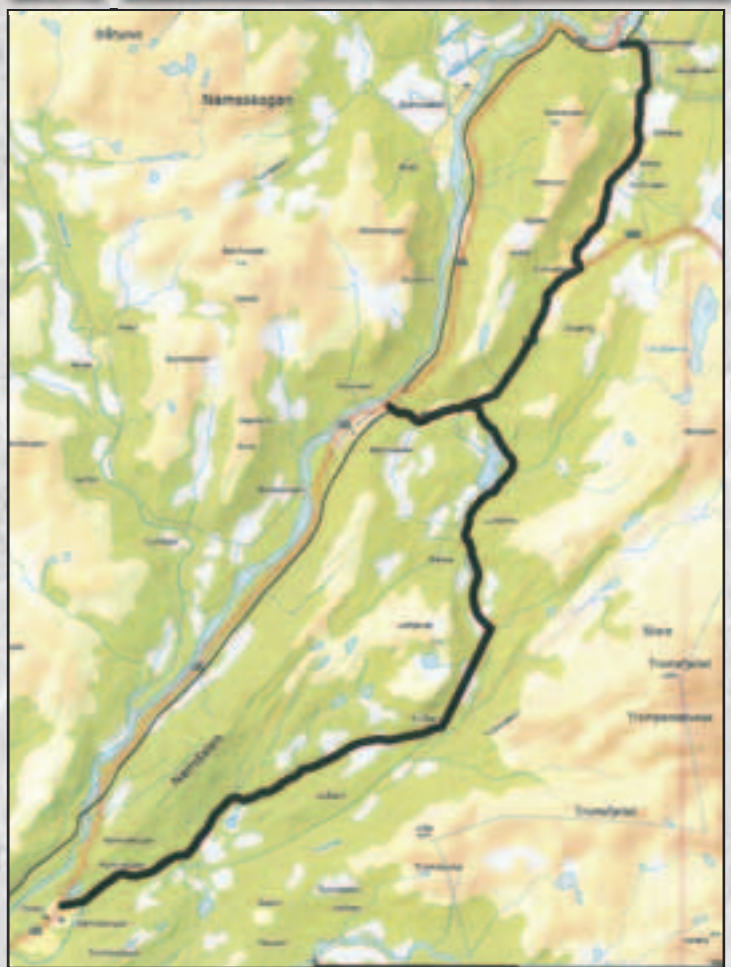
Trones - Namsskogan