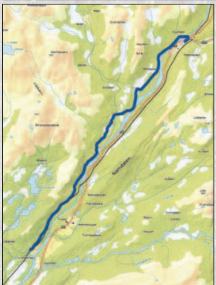
Trones - Brekkvasselv