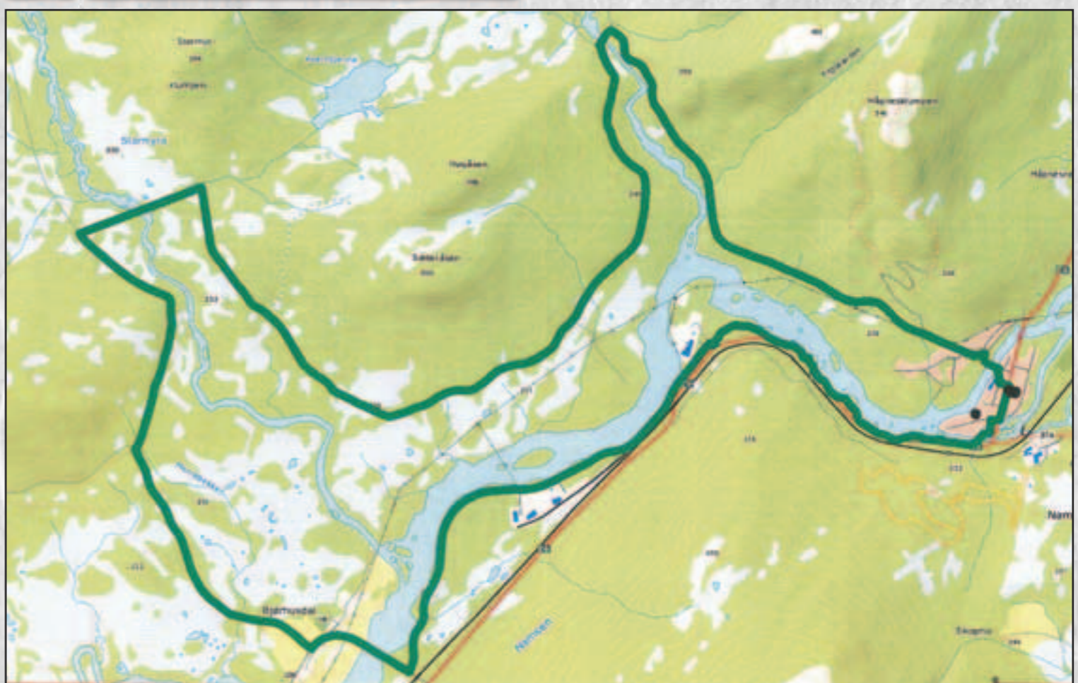
Namsskogan - Bjørhusdalen - Namsskogan