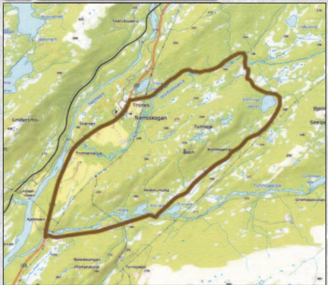
Trones - Sønningsvatnet - Trones